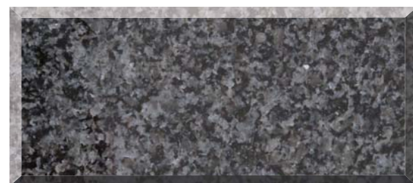
ラスティンバーグ (南アフリカ)